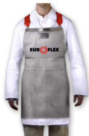
Фартук кольчужный Длина фартука (см) |70|75|80|