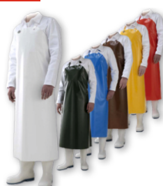
Фартук полиуретановый DELTA Длина фартука (см) |115|