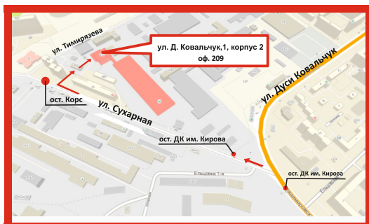
СХЕМА ПРОЕЗДА В НОВОСИБИРСКЕ